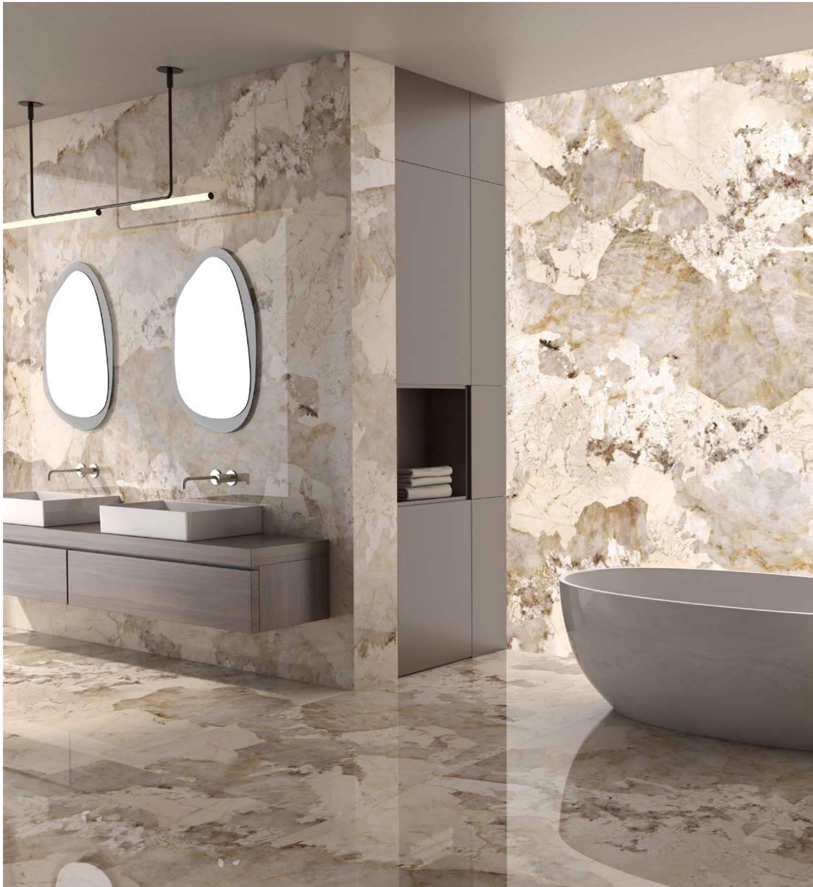
Patagonia Gold Polished BL 1200x3000 Rect.