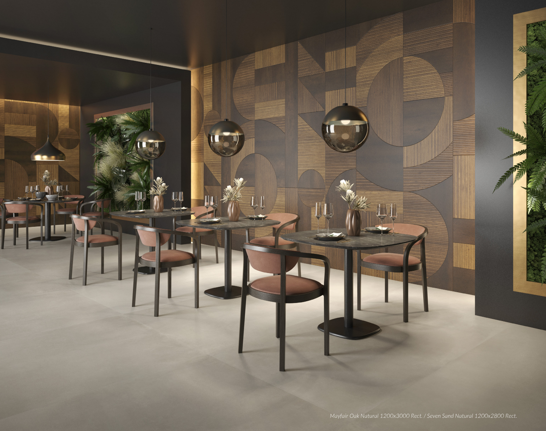
Mayfair Oak Natural 1200x3000 Rect. / Seven Sand Natural 1200x2800 Rect.