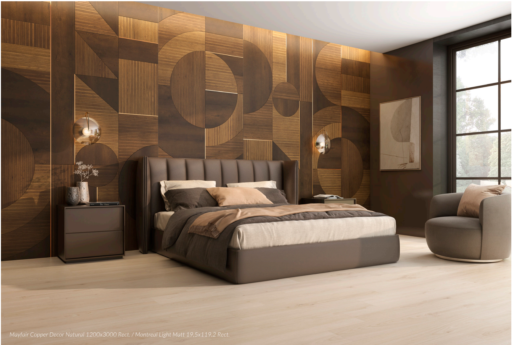
Mayfair Copper Decor Natural 1200x3000 Rect. / Montreal Light Matt 19,5x119,2 Rect.