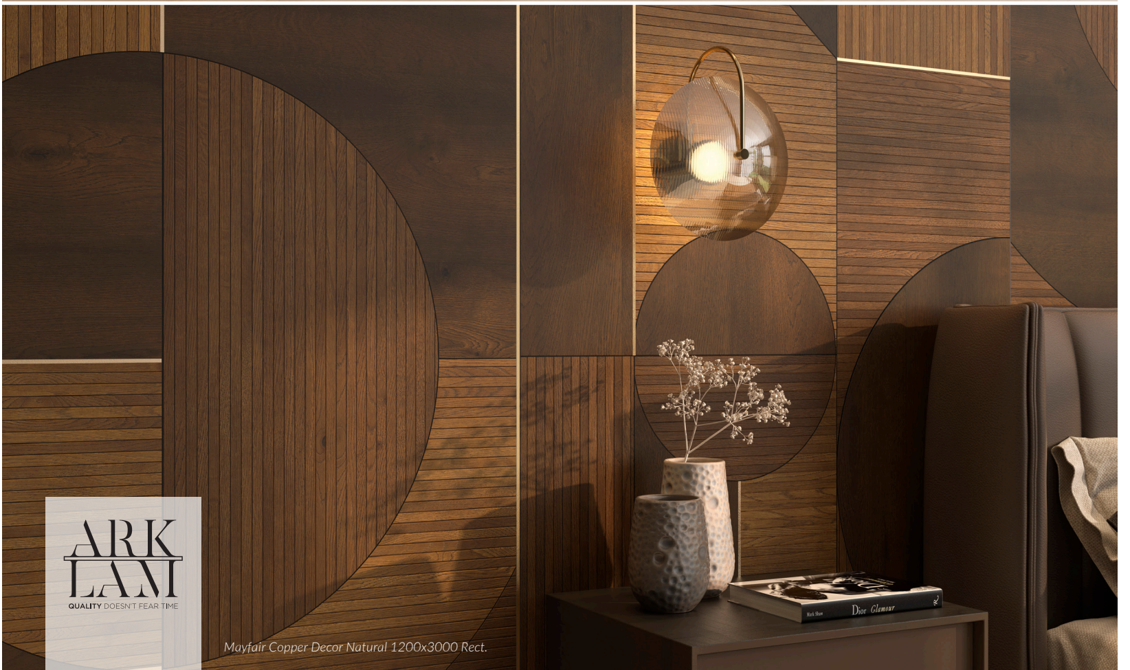
Mayfair Copper Decor Natural 1200x3000 Rect.