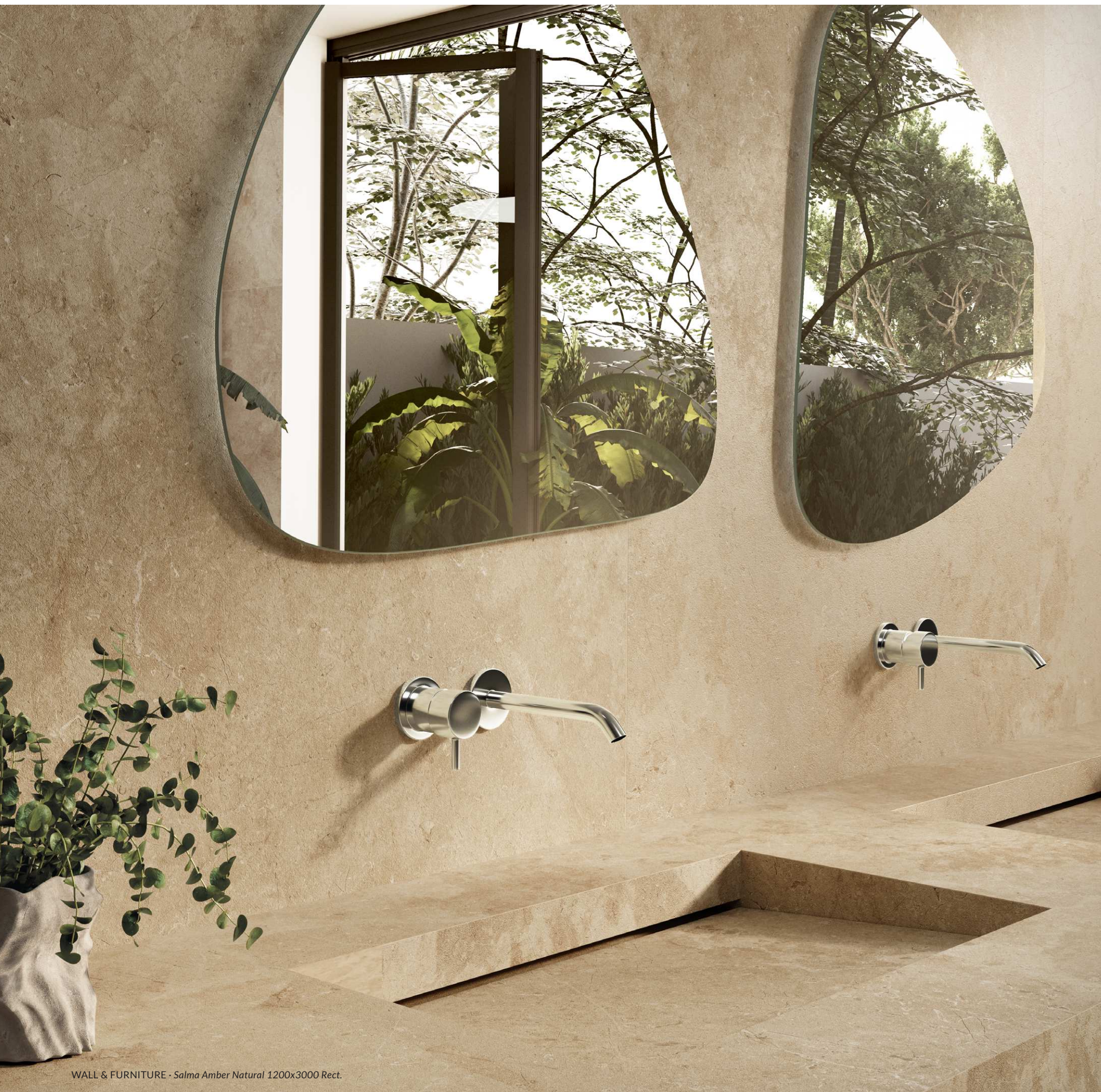
WALL & FURNITURE - Salma Amber Natural 1200x3000 Rect.