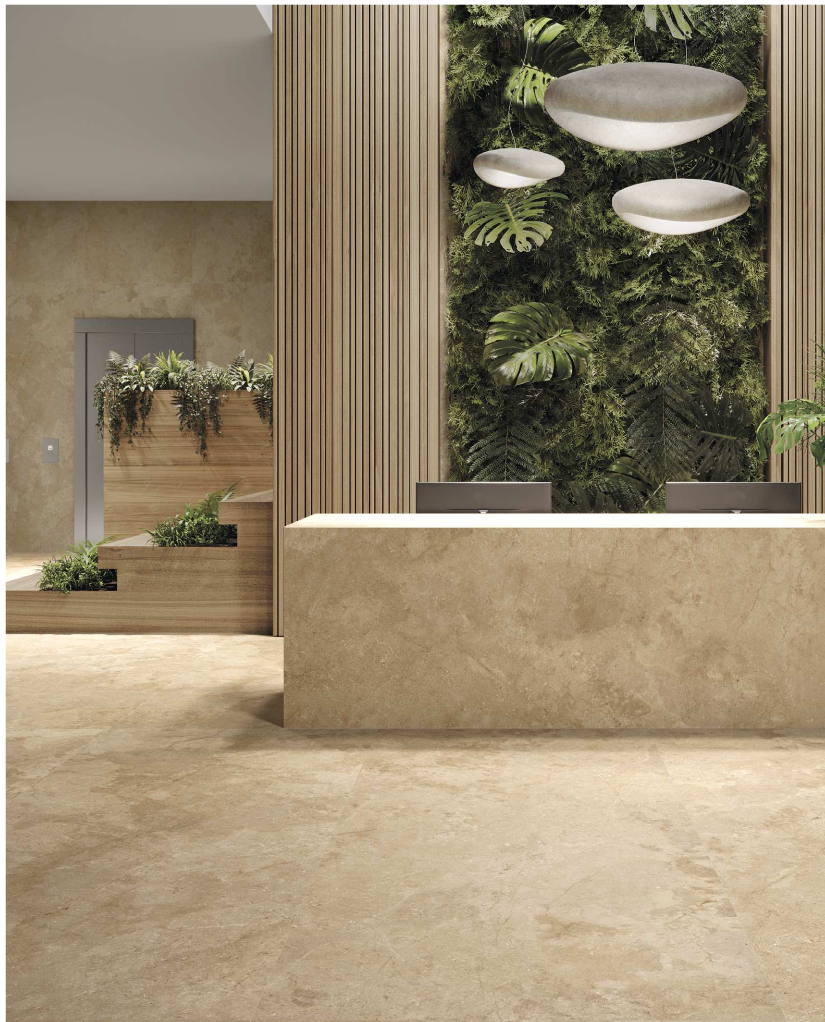
WALL & FLOOR · Salma Amber Natural 1200x3000 Rect. FURNITURE · Salma Amber Natural 1600x3200