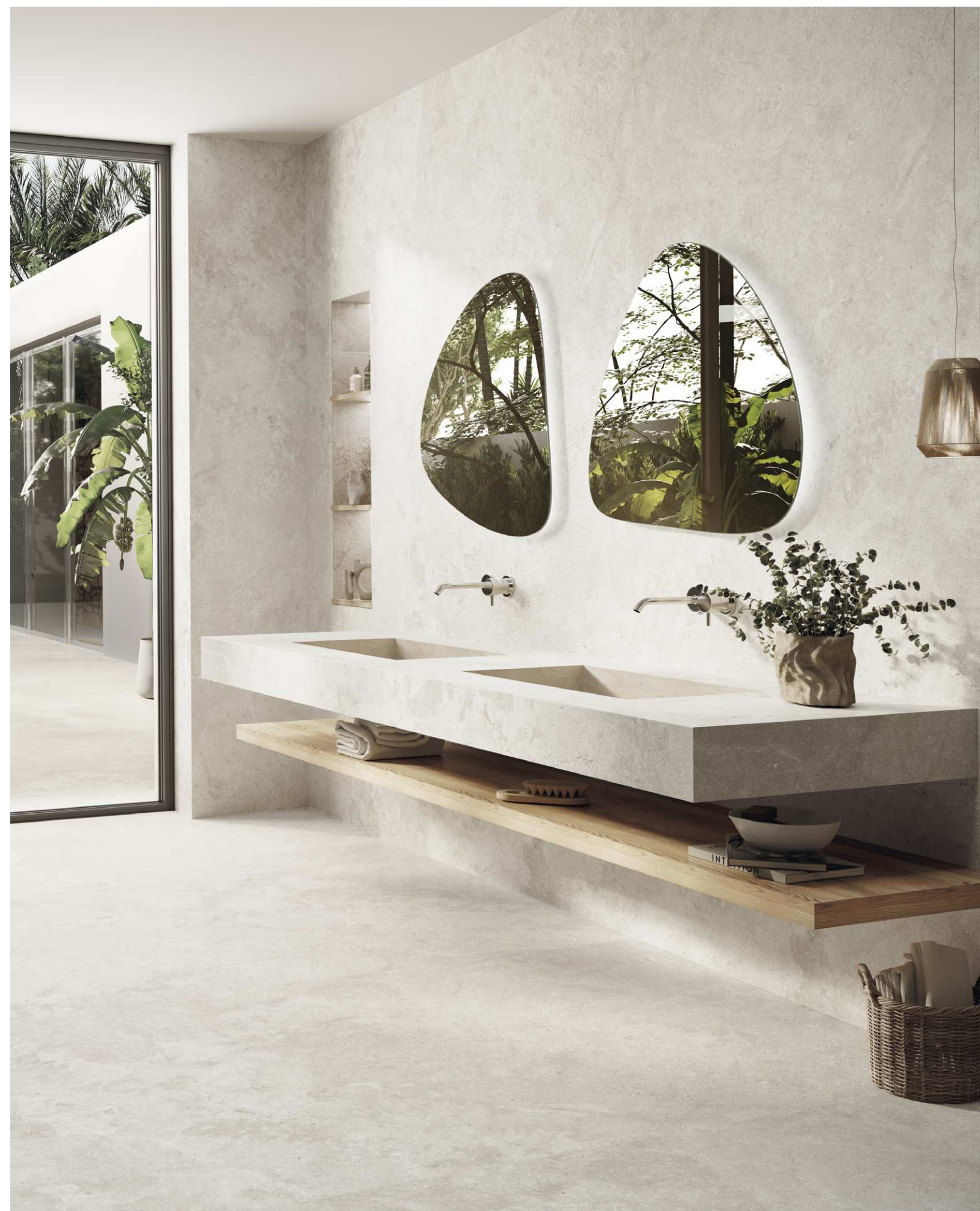
WALL, FURNITURE & FLOOR · Salma Bone Natural 1200x3000 Rect.