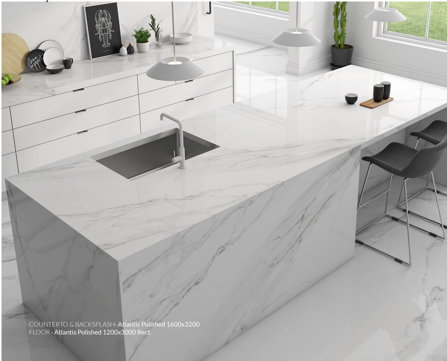
COUNTERTOP & BACKSPLASH • Atlantis Polished 1600x3200 FLOOR • Atlantis Polished 1200x3000 Rect.